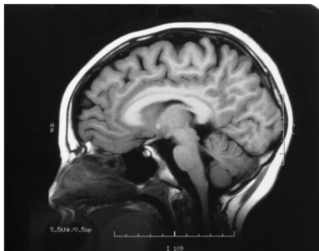
Figura 3 Resonancia magnética nuclear cerebral: leve atrofia difusa en protuberancia, imagen hiperintensa en FLAIR y T2 en región periacueductal.

desde el suelo con apoyo. Se aprecian dificultades psicomotoras tanto a nivel grosero como fino, la hipotonía persiste con normorreflexia. Se encuentran dificultades en el lenguaje con retraso sobre todo a nivel expresivo, no emite palabras, emite algún bisílabo referencial, aunque impresiona su buena comprensión. En ningún momento ha presentado crisis comiciales.